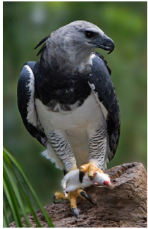
Tom Friedel (CC by 3.0)

El águila harpía ( Harpia harpyja ) es el águila más grande de las Américas, con más de la mitad de su distribución concentrada en Brasil en el Amazonas y el Bosque Atlántico. Las águilas harpías prefieren anidar en árboles que sobresalen del follaje forestal y viven con una dieta compuesta principalmente de presas arbóreas. Esta especie está considerada a nivel mundial como Casi Amenazada, en Brasil como Vulnerable y en el Bosque Atlántico como En Peligro Crítico, debido a la intensa pérdida de hábitat y a la caza.